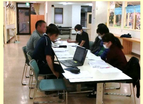
モニタリング会議の様子

B型・就労移行のサービスをご利用の皆様へ、来月4月20日からモニタリングが始まります。そこで、今月から「モニタリング会議」が始まりました。「モニタリング会議」とはモニタリングに向けて職員同士が行う準備的な会議です。各利用者の方々の大まかな支援の方向性や保護者に対する提案事項等を話し合います。会議で話し合われたことは暫定的なものであるため、実際に保護者の方々と交えたモニタリングの内容を受けて柔軟に対応を行います。