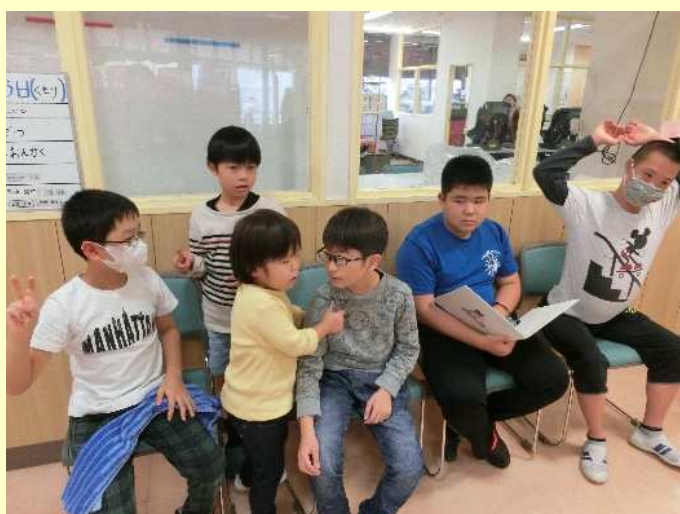
不思議と集まりだしたので記念撮影