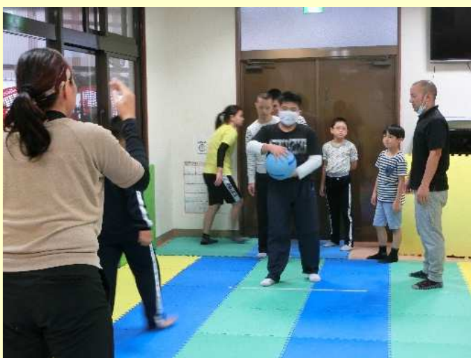
リズム遊びを取り入れて体を動かしました