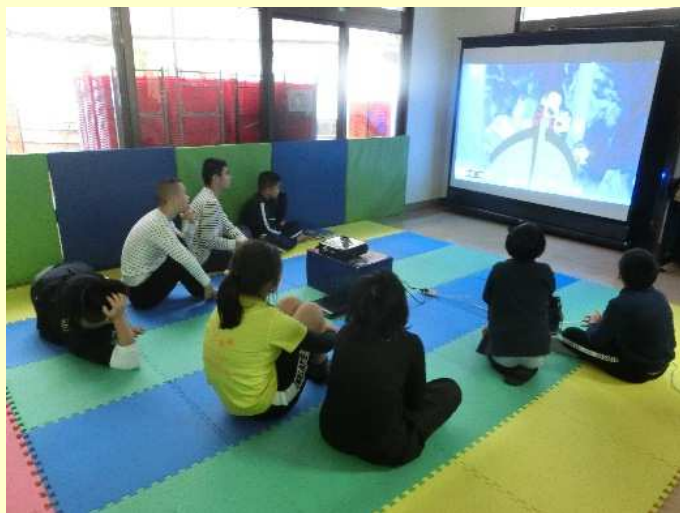
食後は DVD を大画面で見ながらリラックス